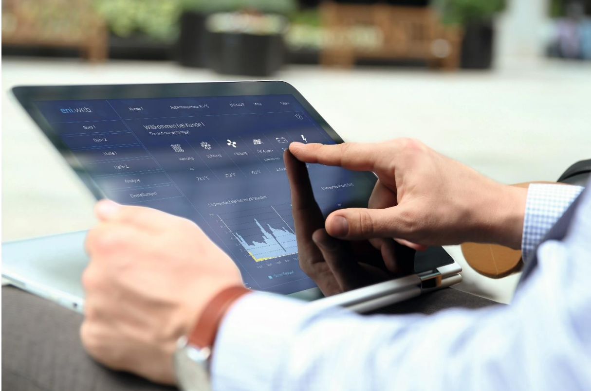
Bild 1: Webbasierte Benutzeroberfläche für volle Kontrolle und maximale Transparenz